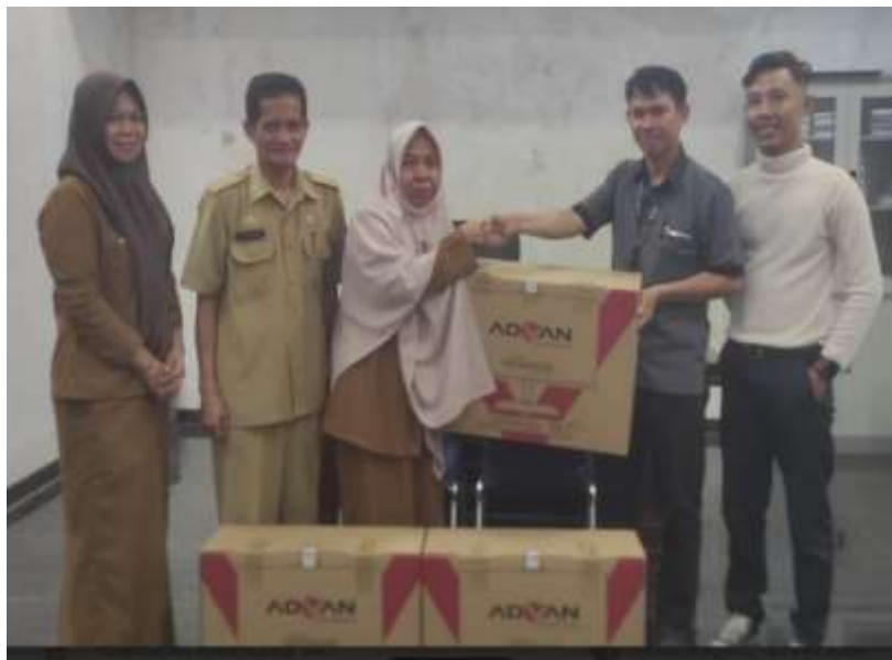
Penyerahan Komputer di Kabupaten Bone