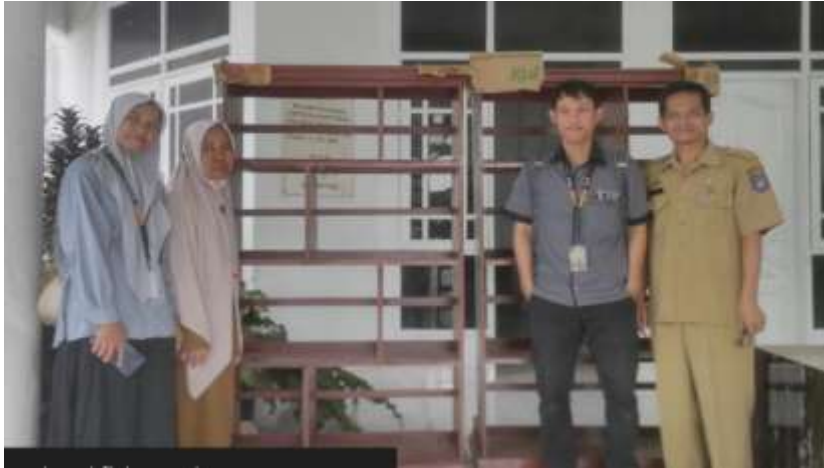
Penyerahan Rak di Kabupaten Bone

Dokumentasi Barang yang di serahkan ke masyarakat