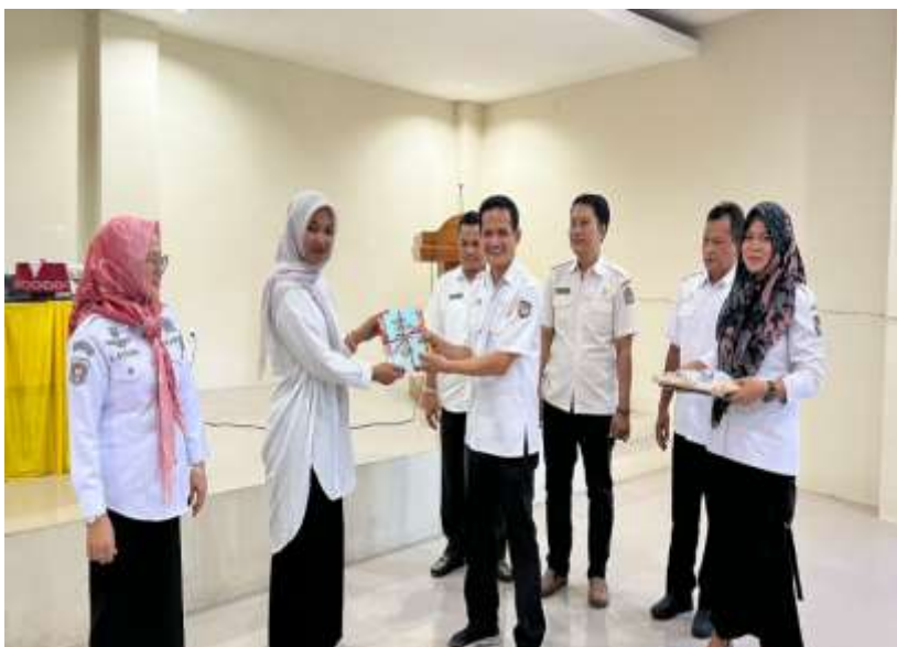
Penyerahan Buku di Kabupaten Bone